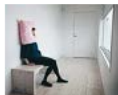
Kudde för dagdrömare är ett av verken som visas.