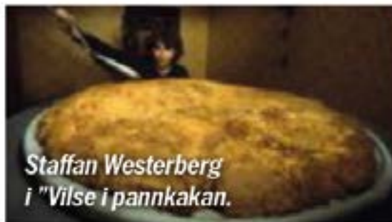
Staffan Westerberg i "Vilse i pannkakan."

✿ Alla som var barn på 1960- till 1980-talet kommer känna igen sig i utställningen Tevetrampolinen , som invigs på Bild-