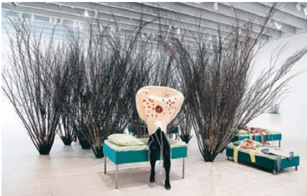
Brita Täljedal, curator, provar en av de sju kostymerna som ingår i verket Vad känner en sköldpadda genom skalet?. Under utställningsperiodens workshops kommer deltagarna att få tillfälle att prova kostymerna.

Vik kulturredaktör: Lars Böhlén 090-17 60 18 E-post: kultur@vk.se