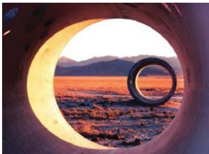
"Sun tunnels" av Nancy Holt som visas stort på Bildmuseet i Umeå.

Ukrainsk samtidskonst, en regnbåge i lättmetall – och den tyske giganten Anselm Kiefer. Här är konstutställningarna att ta till sig i sommar.