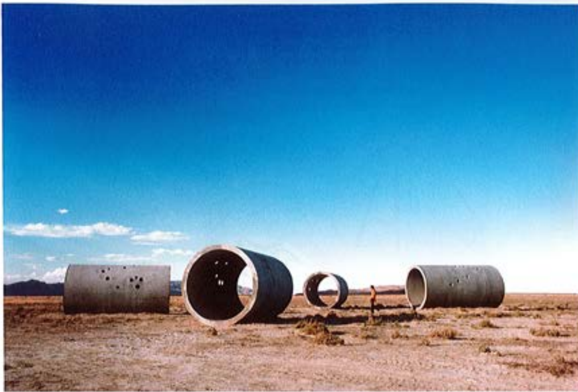
Left Nancy Holt, Sun Tunnels , 1973-76, installation view