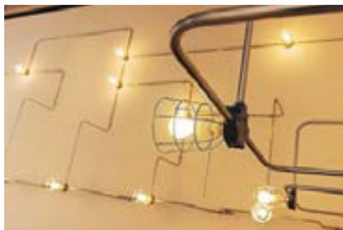
Nancy Holt intresserade sig för människans interaktion med världen och dess flöden, här gestaltat i verket Electrical Lighting for Reading Room.