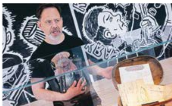
Svepsåken från släkthemmet är central i utställningen – kring denna låg en påfallande tyrsnad, man varken rörde eller talade om den. Men däri låg farfaderns samiska verklighet.

– Jag är en självlärd nävris och har aldrig arbetat i detta format, det var lite löskigt. Jag ville ha ett utmanande som är tydligt kopplat till serievärlden; där det går att teckna sådant som detta. Här jag går runt i mig själv och vill inte släpa mig ut med en släppa.