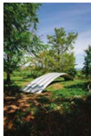
"Rainbow" av österrikiska arkitektbyrån querkraft är årets konstverk på Kivik Art Center i Skåne.