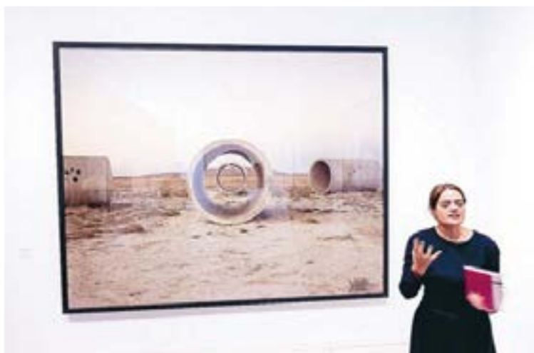
Det omfattande verket Sun Tunnels visas bland annat i form av fotografier av Richard Misrach.

På plan 5 i museet presenteras bland annat i foto, film och skisser hennes mest kända verk, Sun Tunnels, men också hur det började 1966; i språket och poesin, textbaserade verk