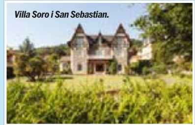
Villa Soro i San Sebastian.

Elkano. De är i sin tur grannar till kult-pintxosbarer som Ganbara, La Viña and Bar Nestor.