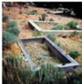
Ovan: Nancy Holt, "Sun tunnels #1", 1988.

Trots storleken och detaljrikdom på Misrach fotografier är det Holts egna fotooviter i mindre format som blir mina favoriter. Med måttade bilder zoomar hon in på ödelagda