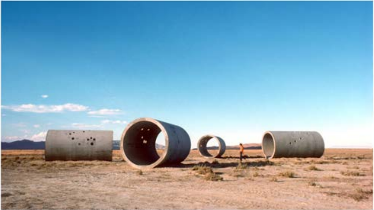
Nancy Holt, Sun Tunnels, 1973–1976. Nancy Holt, Inside Outside, på Bildmuseet samproducerades av MACBA i Barcelona.