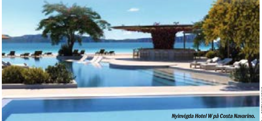
Nyinvigda Hotel W på Costa Navarino.