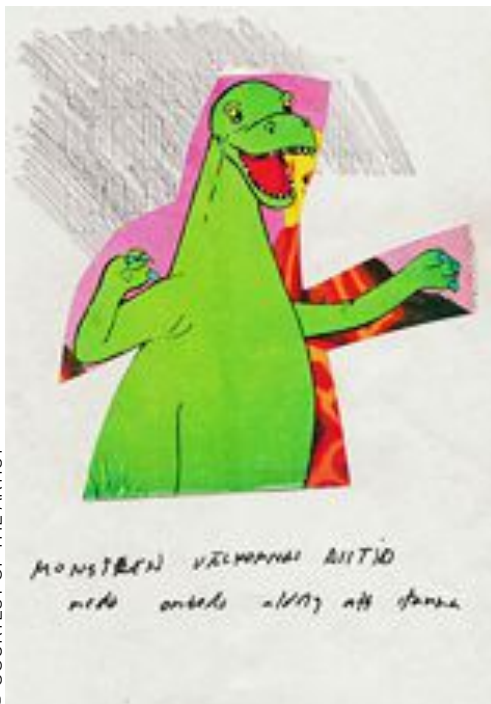
Runo Lagomarsino, Starting with the past, the change.

Västerbottens-kuriren, 19 september 2022