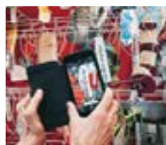
Detalj av verket Vad känner en sköldpadda genom skalet? – med en mobilkamera och Google translate kan de tjeckiska citaten översättas.

Den andra delen av verket består av en gigantisk vitrin, fylld av urklipp på olika existenser, människor, växter, djur, samt en rad citat på tjeckiska, avkodbara för den med en mobilkamera och Google translate. Det bildande anslaget och barnperspektivet är ständigt närvarande och hon kallar också utställningen på Bildmuseet ett