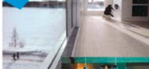
Das neue Bildmuseet Blick auf Kunst und den Fluss Ume Älv.

Das neue BILD MUSEET bietet neben spannenden Foto- und Kunstausstellungen auch eine herrliche Aussicht auf den Fluss Ume Älv. • bildmuseet.umu.se