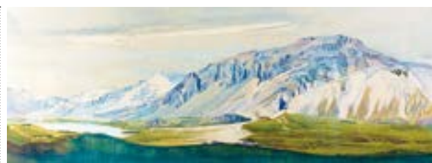
Ásgrímur Jónssons målning "Mt Ketillaguarfjallin Hornafjörður".

"Nell Walden & Der Sturm" visas till den 4 oktober.