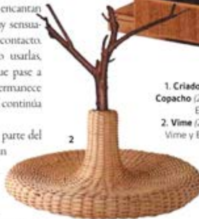
1. Criado Mudo, Colección Copacho (2014). 2. Vime (2014).

tuitos y, por supuesto, de los errores: representan soluciones para futuros proyectos. El diseño se vincula más a la industria, pero nosotros, más próximos al arte, rompemos ese cliché. Estamos en las antípodas de la racionalidad", matiza Humberto, confirmando su visión cosmopolita y sin corsés.