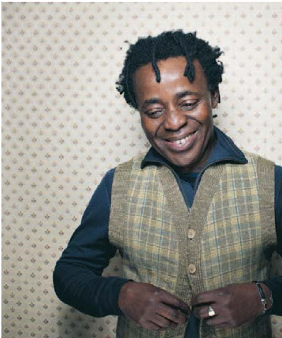
DIASPORAN. I mer än 30 år har John Akomfrah genom konst och filmer skildrat den afrikanska diasporan i Europa.