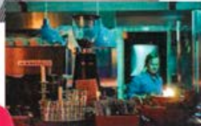
Laut «Guardian» das coolste Restaurant überhaupt: «Gotthards Krog».

Das neue BILD MUSEET bietet neben spannenden Foto- und Kunstausstellungen auch eine herrliche Aussicht auf den Fluss Ume Älv. • bildmuseet.umu.se