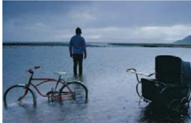
TIDSRESA. Filmen rymmer berättelser från flera århundraden.

Akomfrahs kraftfulla tablåer av hav och makt-