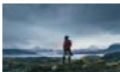
Ur Vertigo Sea av John Akomfrah.