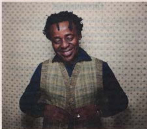
I mer än 30 år har John Akomfrah genom sin konst och sina filmer skildrat den afrikanska diasporan i Europa.

– Ingen väljer att fly med målsättningen att skapa problem eller av vilja att dö. Det handlar om en tvångsmässig utopi, och