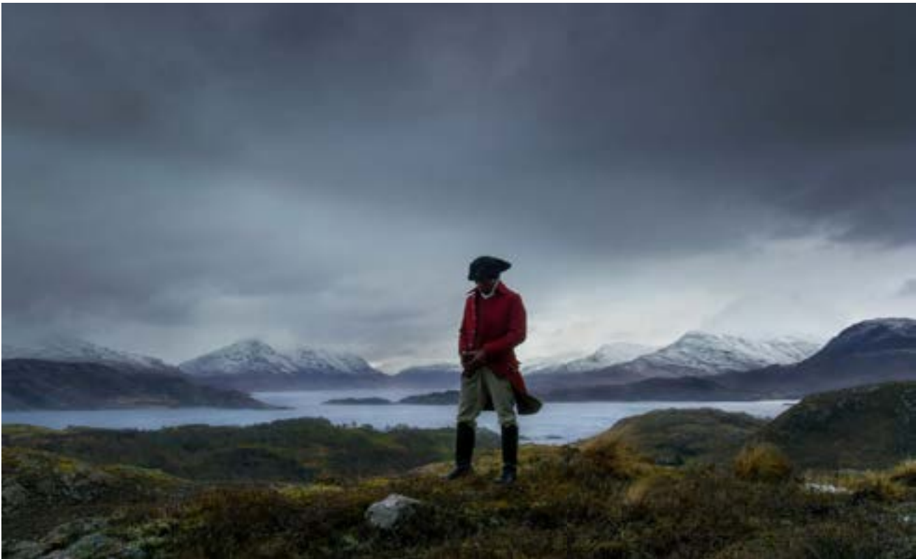
Premiär på Venedigbiennalen. Ur filmtriptyken "Vertigo Sea" som hade premiär under årets Venedigbiennal.