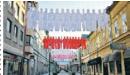
Den kinesiske konstnären Ai Wei Weis bidrag till årets Open Art i Örebro.