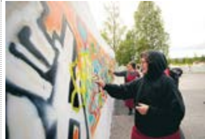
Pensionärer i Boden målar graffiti med den sydafrikanske konstnären Breeze Yoko som kursledare.

"Mien Meo Mieng", samtida konst från Vietnam, visas till den 1 november.