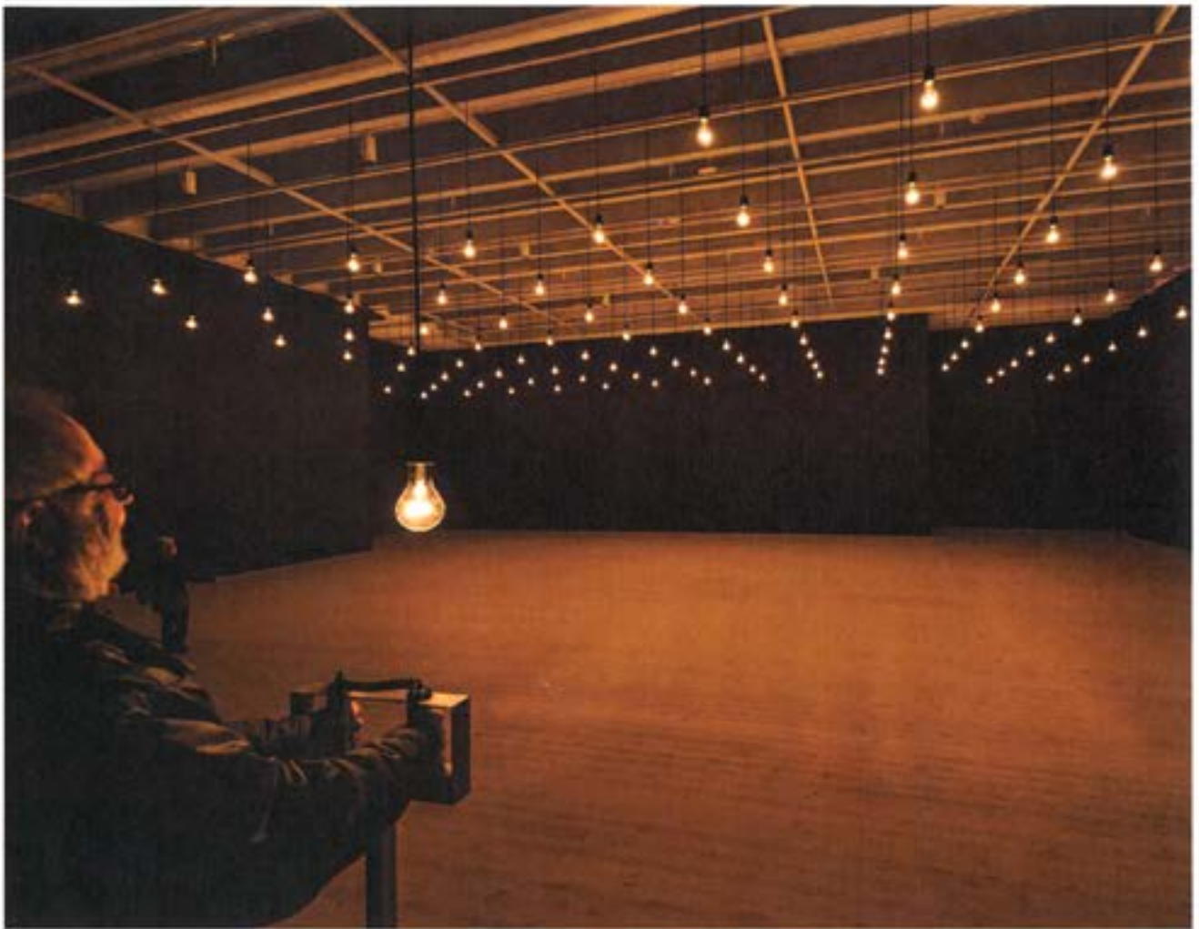
Rafael Lozano-Hemmer, Pulse Room , Bildmuseet 2014.

faculties governing performance of self are being bypassed as technologies go straight to the source, collecting the data they need in order to make more definitive presentations.