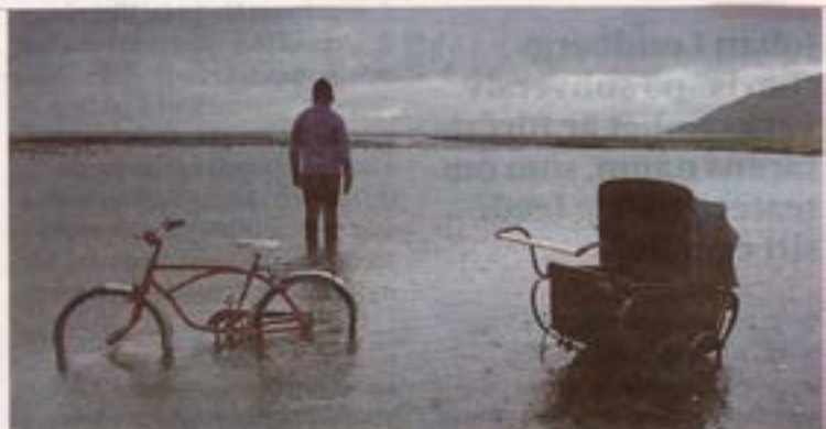
Stillbild ur John Akomfrahs "Vertigo sea".

– I kontrasten mellan det som är vackert och fruktansvärt med havet försöker jag peka på hur världen ser