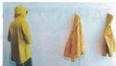
"Pissed Off". Interaktivt ljudverk av Funny Livdotter i samarbete med Daniel Westman.